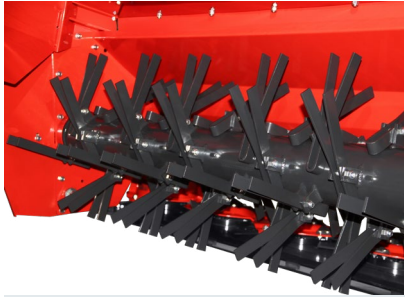
YARI SALINIMLI ÇIRPMA SİSTEMİ BEATER SYSTEM