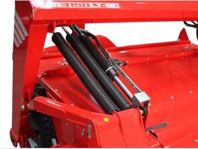
ENGEBELİ ARAZİDE AYARLANABİLİR TABLA ADJUSTABLE TABLE ON ROUGH TERRAIN