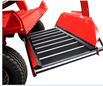
TOPLAYICI BANT COLLECTER CONVEYOR