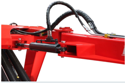
SOLDAN TELESKOPİK SİSTEM LEFT-HAND TELESCOPIC SYSTEM