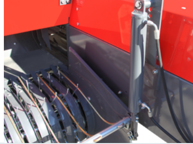
HİDROLİK TABLA AYARI