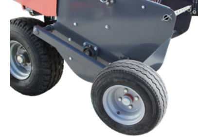
TABLA DESTEK TEKERİ