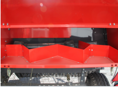
ÇOKLU İP SANDIĞI