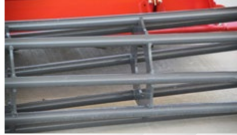
KAFES MERDANE SİSTEMİ ROLLER CAGE