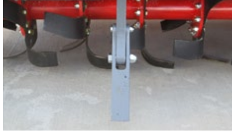
PATLATMA AYAĞI BLASTING LEG