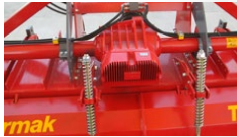
4 VİTES ŞANZİMAN 4 SPEED GEARBOX