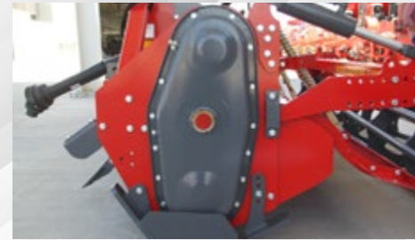
DİŞLİ AKTARMA SİSTEMİ GEAR TRANSFER SYSTEM