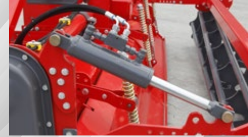
HİDROLİK AYARLI MERDANE SİSTEMİ HYDRAULIC ADJUSTABLE ROLLER